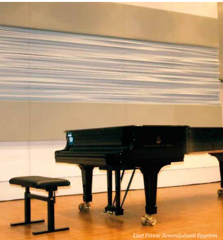
Liszt Ferenc Zeneművészeti Egyetem

– Milyen feltételek szükségeltetnek ahhoz, hogy valaki ezen a területen tevékenykedjen?