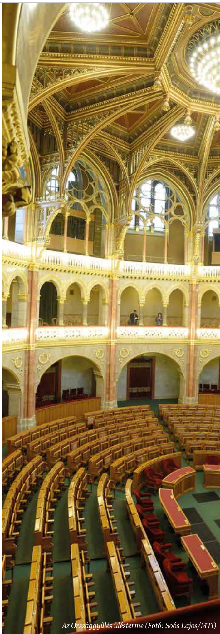
Az Országgyűlés ülésterme